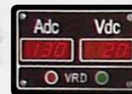
DSP Voltmetro/Amperometro di saldatura & Spia VRD

Il frontalino della centralina DSP è provvisto di un connettore circolare di tipo militare al quale può essere connesso un comando a distanza Mosa o un trainafilo Mosa, per la saldatura MIG MAG. All'inserimento del connettore esterno si effettua automaticamente la commutazione del controllo sulla manopola dell'unità remota.