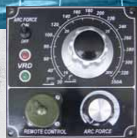
WAC CC/CV Pannello di controllo della saldatura

Inoltre sono indicate per un ampio spettro di usi, tra i quali la costruzione metallica, edilizia, pipeline e cantieri navali. Corrente di saldatura continua con elettrodi fino a 8 mm di diametro, compresi anche gli elettrodi cellulosici. Sono motosaldatrici carenate e insonorizzate.